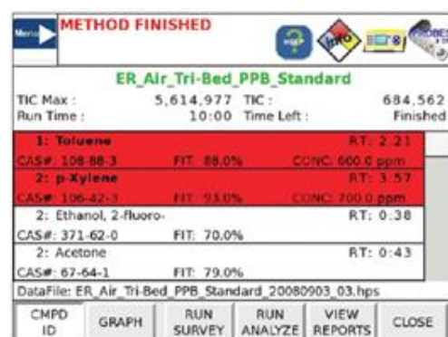
Rysunek 2 "Wynik analizy i informacja o niebezpieczeństwie"